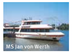
MS Jan von Werth