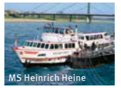
MS Heinrich Heine